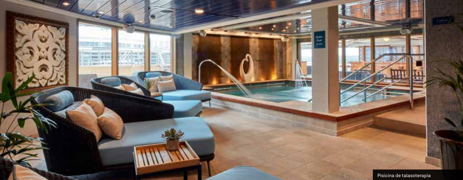
Piscina de talasoterapia